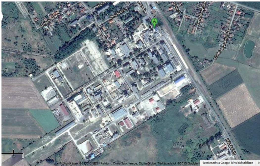
Ecomissio Kft. elhelyezkedése az Alkaloida Vegyészeti Gyár Zrt. telephelyén