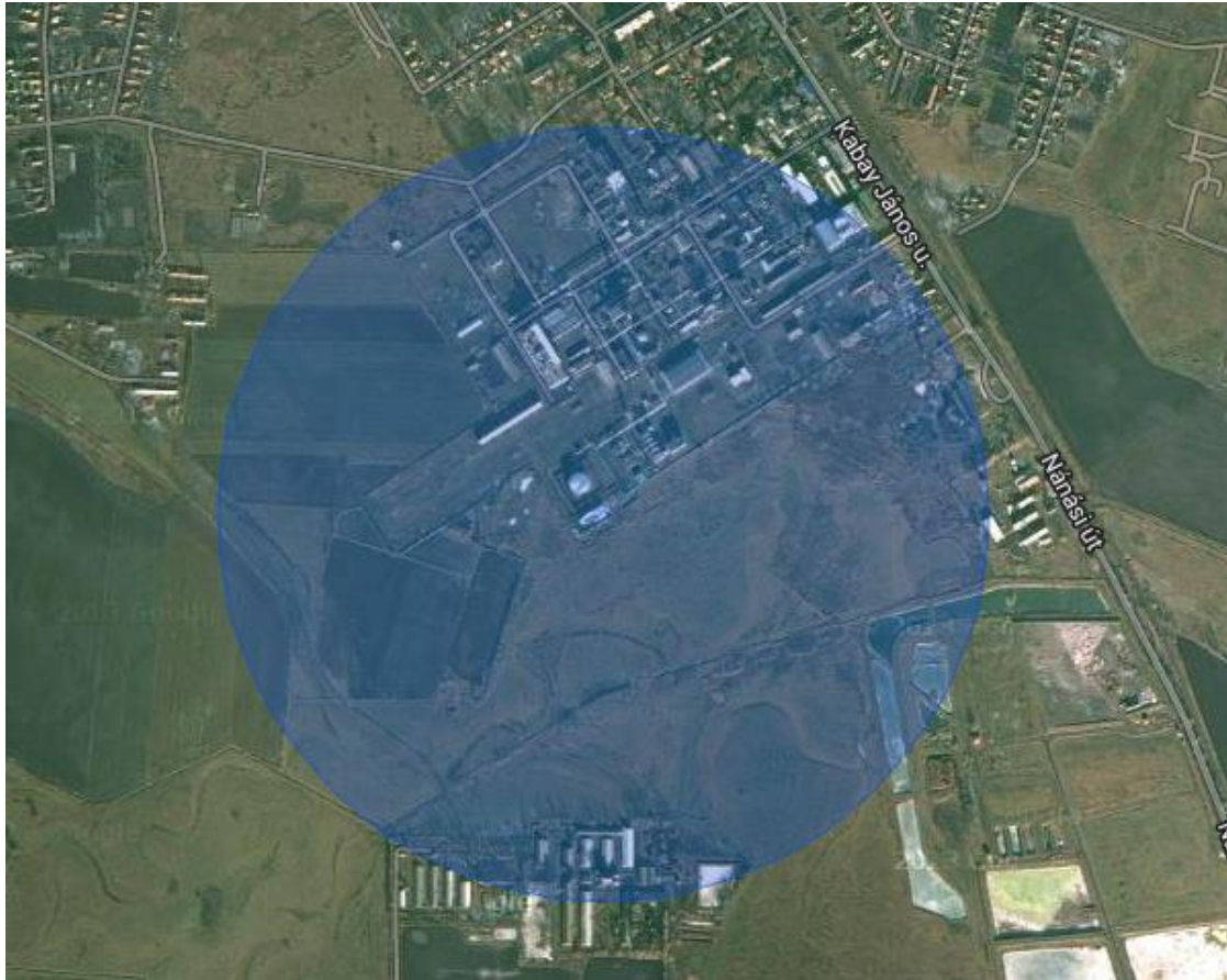
Mérgezés 1%-os halálozás outdoor esetben (szabadban tartózkodókra) Tájékoztatói zóna 602 m

Az üzemben bekövetkező veszélyes esemény következtében kijutó mérgező gáz (pl. hidrogén-cianid) veszélyt okozó hatásának legnagyobb távolsága a kibocsátóforrástól 602 m az aktuális szélirányban. A legnagyobb, csak rendkívül kedvezőtlen időjárási körülmények közt várható toxikus hatósugar éppen eléri a lakott területeket, ennek hatása más üzemeltetőket veszélyeztethet az Alkaloida Vegyészeti Gyár Zrt. telephelyén és a déli irányban a mezőgazdasági területeken, valamint –igen ritkán előforduló szélirányok esetén- érinthetnek a lakóterület szélén 6 lakóházat és annak lakóit.