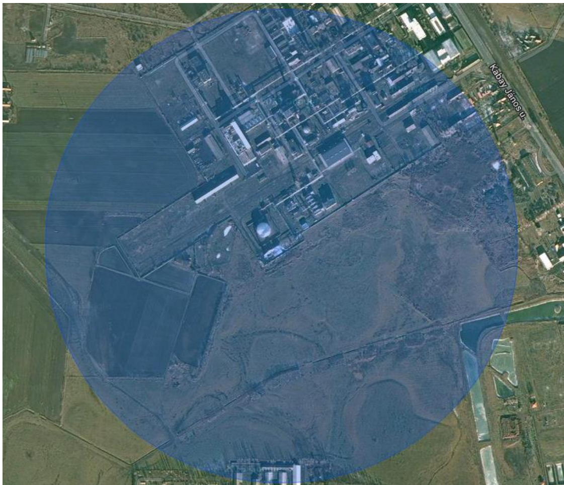
Mérgezés 1%-os halálozás indoor esetben (épületben belül tartózkodókra) Kimenekítési zóna 542 m

A kimenekítési zóna (542 m) nem terjed az Alkaloida Vegyészeti Gyár Zrt. telephelyének területén kívülre, csak a telephely területén tartózkodókra érvényes.